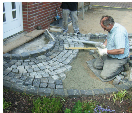
Układanie kostki brukowej na zaprawie PCI Pavifix ® DM