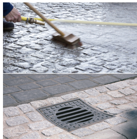
W przypadku metody szlamowania PCI Pavifix ® CEM można łatwo aplikować w spoiny.