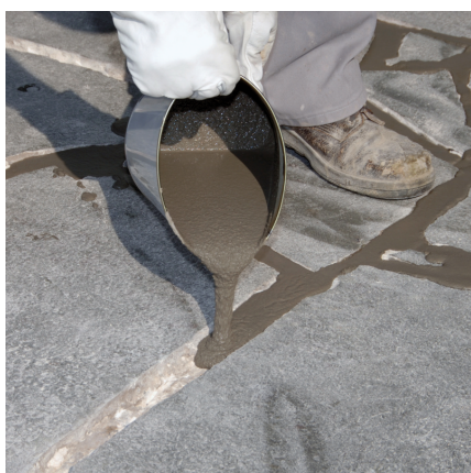
Odpowiednim naczyniem do zalewania wprowadzić PCI Pavifix® CEM w przygotowane spoiny.