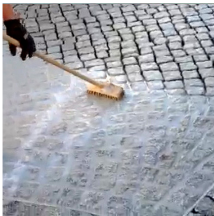
W metodzie szlamowania PCI Pavifix® CEM można łatwo wprowadzić w spoiny.