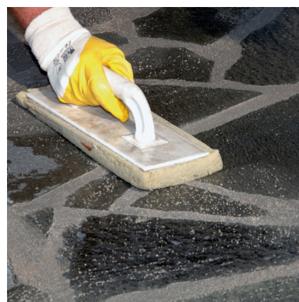
W ciągu godziny zmyć powierzchnię kamienia packą z gąbką.