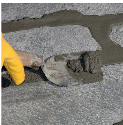
Usunąć nadmiar materiału kielnią.