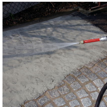
W celu uniknięcia wypłukiwania spoin podczas czyszczenia kostki brukowej należy trzymać strumień wody niemal równoległe do powierzchni.