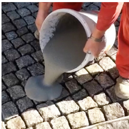
Aplikacja PCI Pavifix® CEM na powierzchnię przeznaczoną do spoinowania.