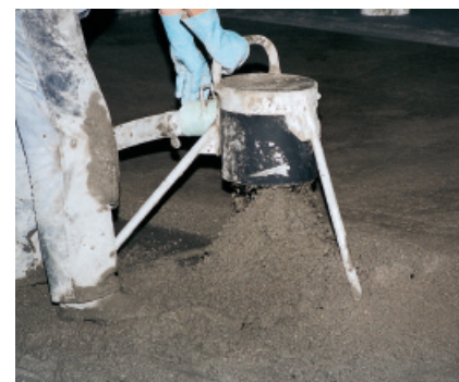
Szybkosprawny jastrych na spoiwie PCI Novoment ® Z3 charakteryzuje się długim czasem użycia, również w wysokich temperaturach oraz możliwością podawania pompą.