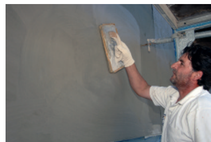
PCI Nanocret® FC — szpachłówka do napraw betonu w zakresie grubości warstwy od 1 do 10 mm.