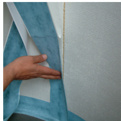
Usunąć folię, przyłożyć taśmę bez naprężania do podłoża i docisnąć – gotowe!